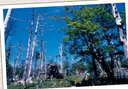
おおだい が はら 大台ヶ原