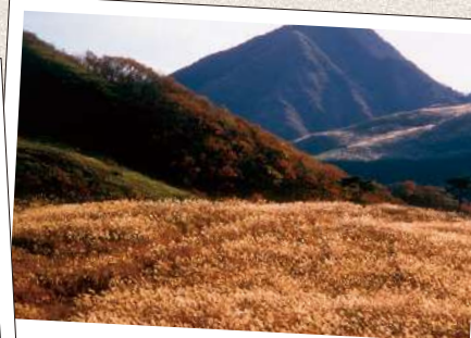
そに こうげん 曽爾高原

写真提供:【(一財)奈良県ビジターズビューロ】東大寺、薬師寺、平城宮跡、東大寺修二会、若草山からの夜景、若草山山焼き、今井町、葛城高原、若草山、みたらい溪谷、大台ヶ原、高田千本桜、曽爾高原／【春日大社】春日大社、春日若宮おん祭り／【株式会社 飛鳥園】法隆寺／【元興寺】元興寺／【なら瑠璃絵実行委員会】なら瑠璃絵／【金峯山寺】金峯山寺・蓮華会・蛙飛び行事／【橿原神宮】橿原神宮／【談山神社】談山神社、けまり祭／【室生寺】室生寺／【大神神社】大神神社／【明日香村】石舞台古墳、稲渚の棚田／【信貴山朝護孫子寺】信貴山朝護孫子寺／【宇陀市教育委員会】宇陀松山の町屋／【(一社)大和郡山市観光協会】史跡郡山城跡、大和郡山お城まつり／【五條市観光振興課】陀々堂の鬼はしり／【おふさ観音】おふさ観音風鈴まつり／【天理市総合政策課】ちゃんちゃん祭り／【大和高田市広報広聴課】奥田の蓮取り行事／【玉置神社】玉置神社／【十津川村】谷瀬の吊り橋、瀬峡、玉置山、果無集落／【橿原市立こども科学館】橿原市立こども科学館／【生駒山上遊園地】生駒山上遊園地／【(一財)公園財団 飛鳥管理センター】四神の館／【空中の村】空中の村／【奈良県営うだ・アニマルパーク】奈良県営うだ・アニマルパーク／【農業公園 信貴山のどか村】農業公園 信貴山のどか村／【奈良県中和公園事務所】奈良県営馬見丘陵公園／【御杖村】三峰山、不動の滝／【川上村水源地区】蜻蛉の滝、【野迫川村産業課】雲海景勝地／【吉野町産業観光課】吉野山／【天川村地域施策課】五代松鍾乳洞、面不動鍾乳洞 写真撮影:【三好和義】東大寺／【写真家 桑原英文】元興寺／【木村昭彦】修二会(お水取り)