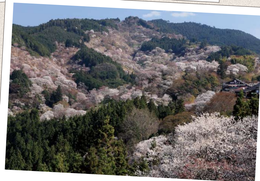
よしの やま 吉野山