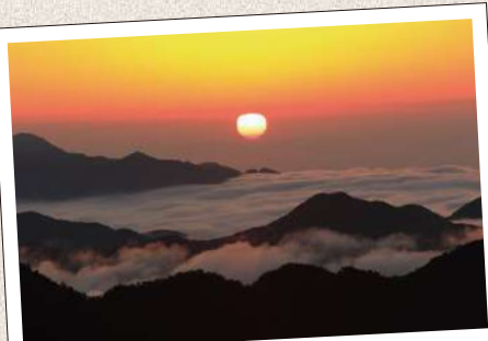
たまき やま 玉置山