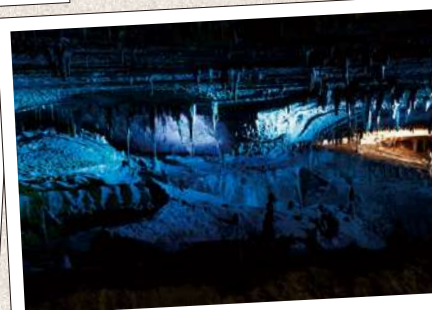
めん ふ どうしやうにゅうどう 面不動鍾乳洞