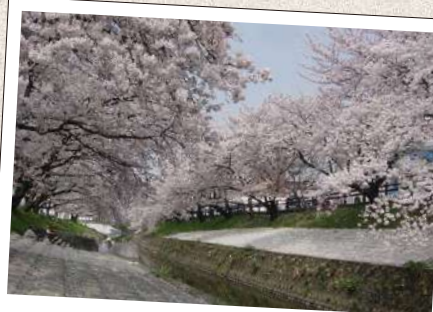
たかだ せんほんざくら 高田千本桜