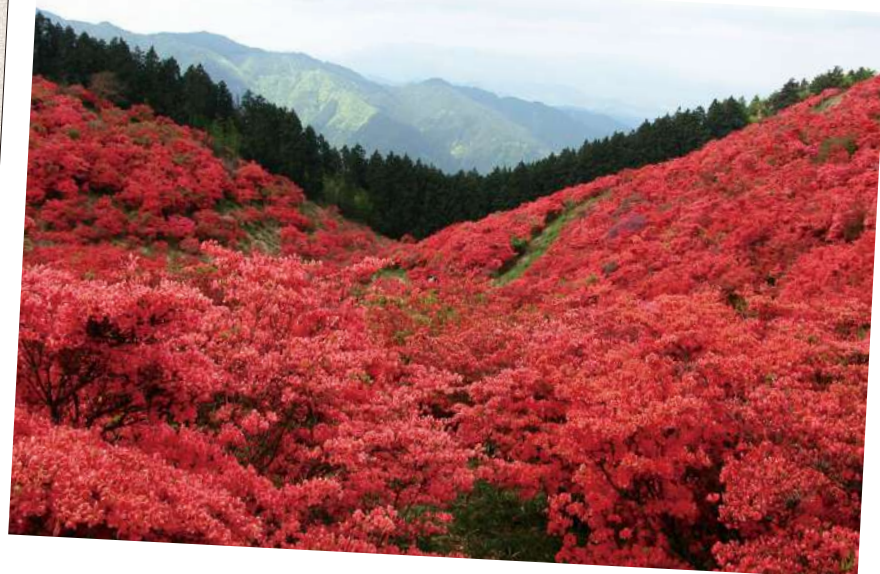
かつらぎ こうげん 葛城高原