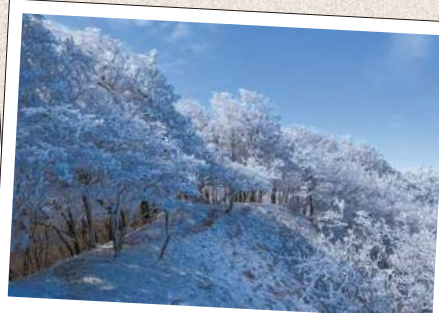
みうねやま 三峰山