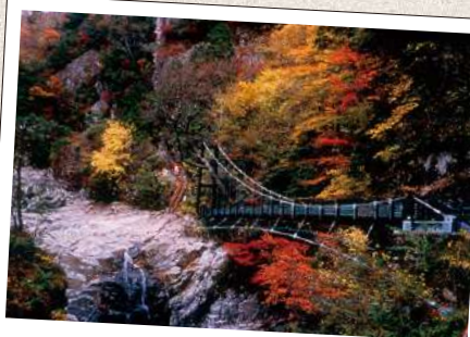
みたらい けいこく てんかわむら みたらい溪谷(天川村)