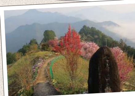
はてなししゅうらく 果無集落