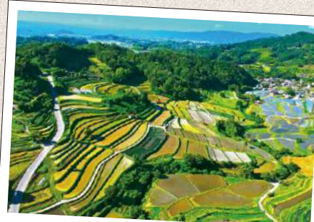
いなぶち たなだ 稲渚の棚田