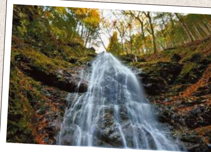
せいいい たき 蜻蛉の滝