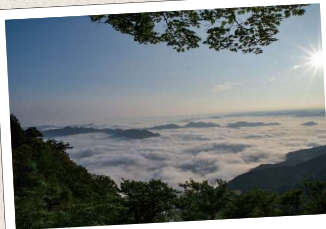
うんかいけいしやうち のせがむら 雲海景勝地(野迫川村)