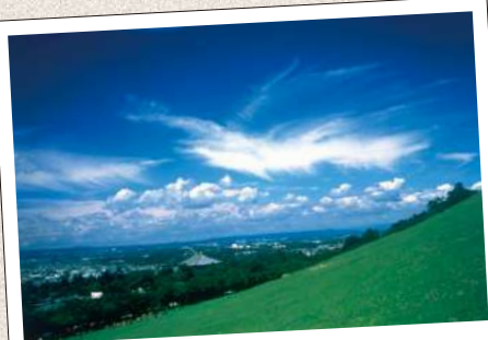
わかき やま 若草山