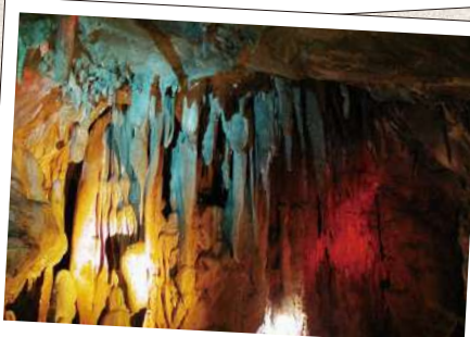
ご まつしやうにゅうどう 五代松鍾乳洞